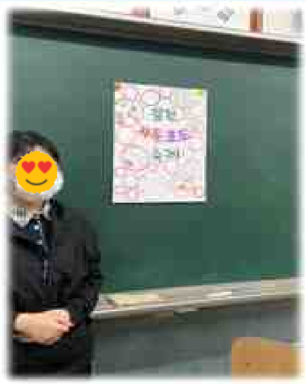
김천 자두 포도 축제