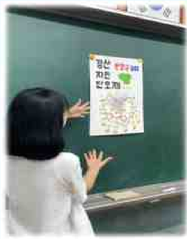
경산 자인 단오제