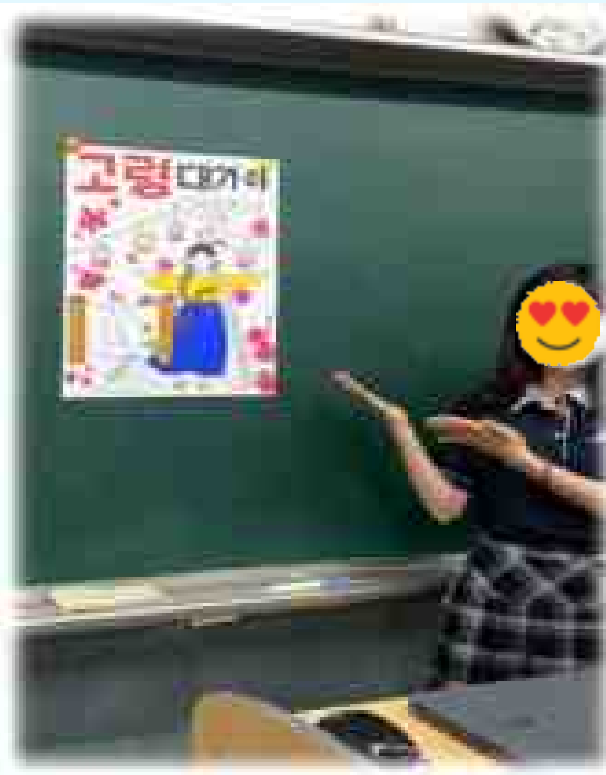
고령 대가야 체험 축제