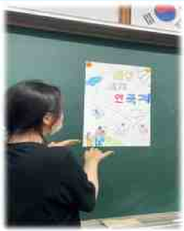
의성 세계 연 축제