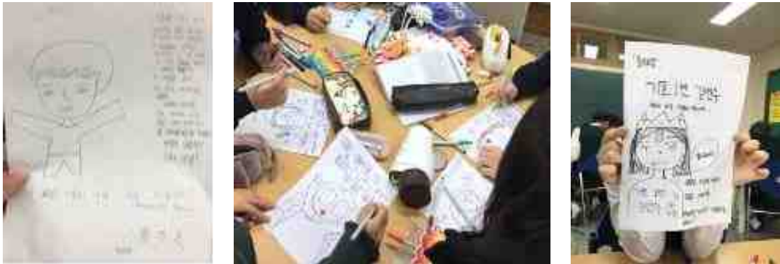
- 자료사진은 2019년 수업 사진으로 2021년에는 포스터 만들기 작업은 하지 못함.